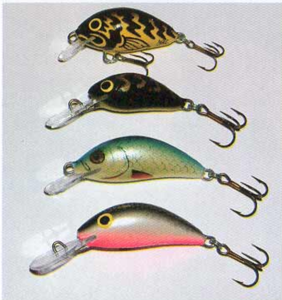
Salmo wobleri za klena i protfiša: Tiny 3, Hornet 2, Hornet 3 plitkoroneći i dubokoroneći

Ribolov u kasnim večernjim satima je takođe veoma interesantan. Primetio sam da se u trenucima pred sumrak, kada vetar stane i mali insekti počinju da lete iznad vodene površine, počne nešto dešavati u reci. Voda kao da proključa na nekim mestima i riba počinje da se hrani tim insektima. Klen i protfiš se takođe podignu sa dna do površine. Riba se hrane kao lude i jedu sve što se mrda na površini. No, i pored toga, ostaju veoma oprezne. Otkrio sam varalicu koja u tim trenucima biva gotovo momentalno progutana ako je zabacimo u zonu hranjenja. To je ponovo Salmo Tiny, posebno u BT boji. Varalicu treba povlačiti tako da ne zaroni dublje od 5 cm i mora