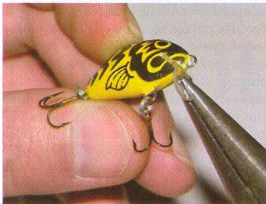
Podešavanje malog Salmo Tiny-ja za površinski lov - savijte pažljivo spojler malo na dole

sivnom vibracijom. Dobri su oni koji rade na površini. Klen voli da pokupi hranu sa vodene površine, a gledati pritom njihove napade na varalicu veoma je uzbudljivo.